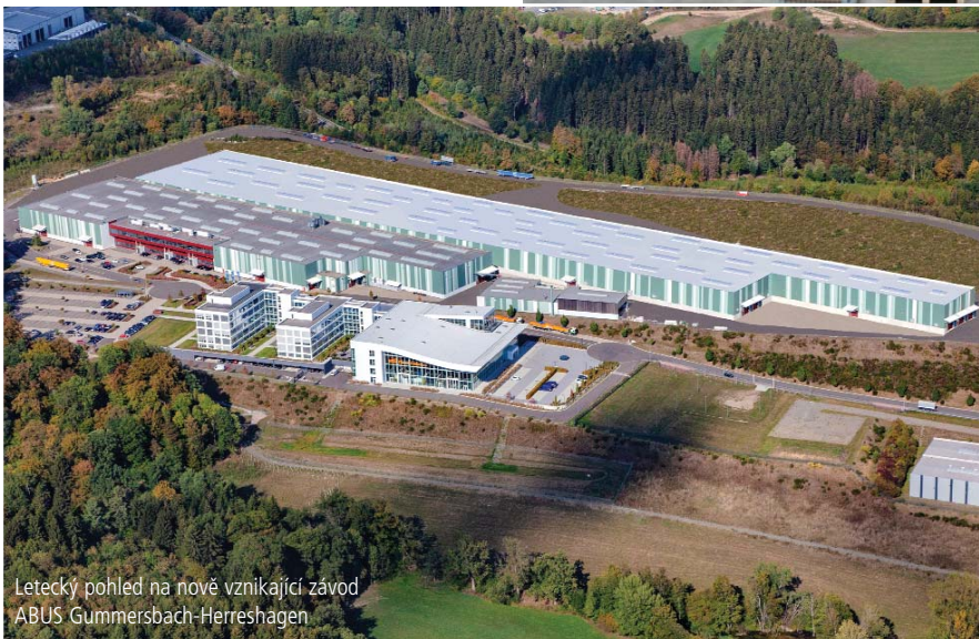
Letecký pohled na nově vznikající závod ABUS Gammersbach-Herreshagen

těšit. Jak nám sdělil pan ředitel: „Po nákupu by nás zákazník neměl 2–3 roky potřebovat, přesto poskytujeme okamžitý servis. Neustálým vzděláváním našich servisních techniků a nabídkou školení v KranHausu tak stabilizujeme zákazníky.”